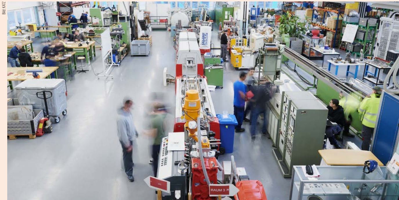
Das Kunststoff-Ausbildungs- und Technologiezentrum in Aarau bietet Weiterbildungsmöglichkeiten und vermittelt Fachwissen. Träger des KATZ ist ein Verein mit etwa 200 Mitgliedern, mehrheitlich Unternehmen der Kunststoffbranche.

Die Aufgabe des Kunststoff-Ausbildungs-Technologie-Zentrum (KATZ) ist es, die Kunststoffbranche zu unterstützen, insbesondere die kleinen und mittleren Unternehmen, die nicht so viele Ausbildungs- und Entwicklungsressourcen haben.