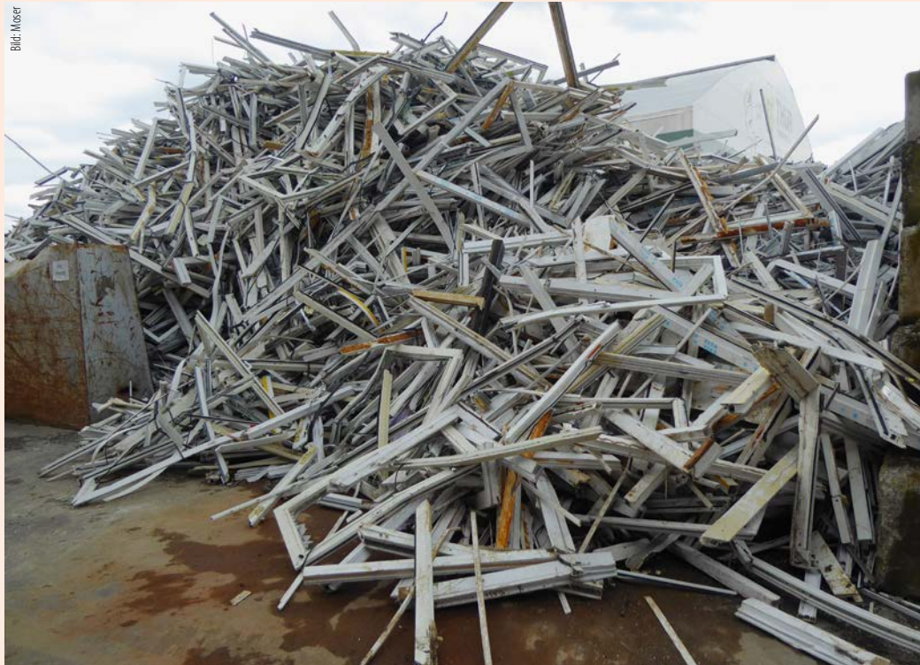
Ausgebaute Fensterrahmen warten auf dem Areal des Recycling Centers auf ihre Weiterverwertung.