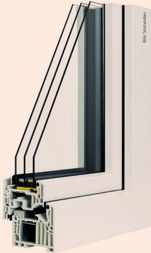
Eine Smartwindows Classico Musterecke: Dieses PVC-Fenster erhielt das «eco1»-Zertifikat.